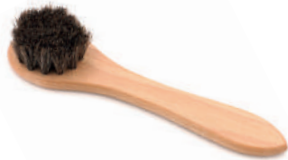
Escova para creme