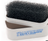
Espanja para camurça e nubuck